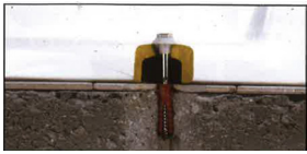
Fourreau de protection céramique